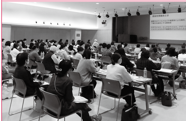
支部支所および行政共催の ノロウイルス食中毒予防講習会