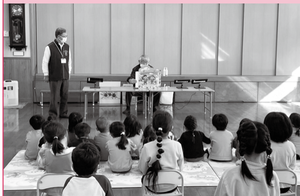
紙芝居を使用した手洗い教室