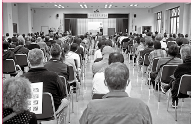
食品衛生責任者を対象とした ノロウイルス講習会