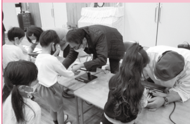
手洗いマイスターによる手洗い講習会