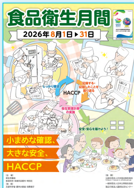
(現状のラフ画です)

また、本期間中は全国の食品衛生協会が食品等事業者を含む消費者の皆さまへ食中毒防止等に関わる啓発活動を実施します。日食協では啓発ツールとして各種ポスター、リーフレットを取り扱っておりますので、ぜひ下記商品を中心にご利用ください。