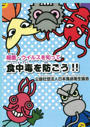
体裁: A6判・105mm×148mm 価格: 21円(税込)