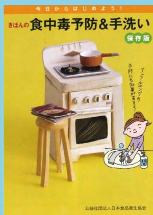
体裁: A6判・105mm×148mm 価格: 32円(税込)

7月中に発行予定の増刷版は、見開き1~2Pに「手洗いいちまんじゃく!」の歌詞を掲載しております。手洗い教室でご活用下さい。