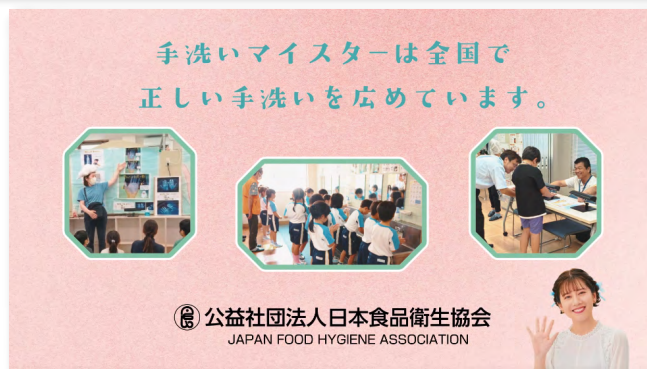
CM動画の一部：ACジャパンより