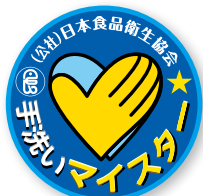
手洗いマイスターのシンボルマーク