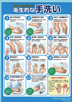
体裁: A4判 価格: 32円(税込)