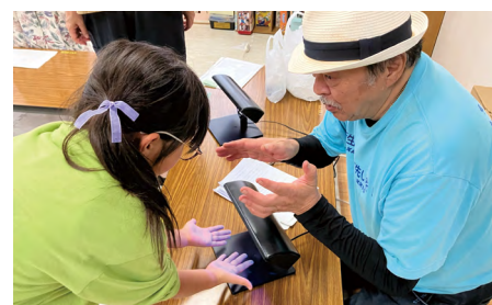
手洗いチェッカーを使ってアドバイスする様子 (柏市食品衛生協会主催の手洗い教室より)